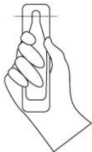
TAGLIARE SEGUENDO IL SEGNO TRATTEGGIATO