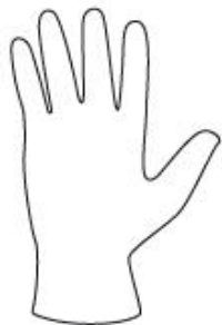
INDOSSARE IL GUANTO INCLUSO NELLA CONFEZIONE